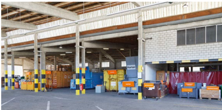
oben: Auf den Surseer Strassen unterwegs. links: In den Sammelhöfen – im Bild in Sursee – werden Wertstoffe getrennt gesammelt.